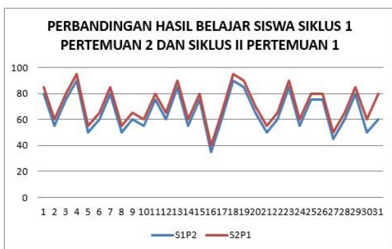
Gambar4 . Grafik Perbandingan Hasil Belajar Siswa Pada Siklus I Pertemuan 2 Dan Siklus II Pertemuan 1

Hasil evaluasi proses perbaikan pembelajaran Bahasa Indonesia materi Teks Eksposisi di kelas 8.1 SMP Negeri 1 Setu dengan penerapan Cooperative Learning tipe STAD untuk meningkatkan hasil belajar Bahasa Indonesia materi Teks Eksposisi kelas 8.1 SMP Negeri 1 Setu pada pelajaran Bahasa Indonesia materi Teks Eksposisi membuktikan bahwa perubahan peningkatan hasil belajar Bahasa Indonesia materi Teks Eksposisi siswa yaitu rata-rata kelas 65,65 dengan 14 siswa tuntas atau 45,16% dari 31 siswa pada Siklus I Pertemuan 2, meningkat menjadi 71,29 dengan 15 siswa tuntas atau 48,39% dari 31 siswa pada Siklus II Pertemuan 1.