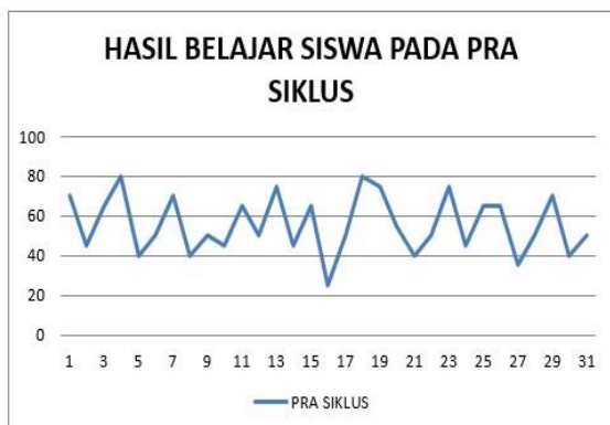
Gambar 1. Grafik Hasil Belajar Siswa Pada Pra Siklus

Dari data awal penelitian meningkatkan hasil belajar Bahasa Indonesia materi Teks Eksposisi pada siswa kelas 8.1 SMP Negeri 1 Setu dengan penerapan Cooperative Learning tipe STAD. Aktivitas berkaitan dengan hasil belajar Bahasa Indonesia materi Teks Eksposisi siswa selama proses pembelajaran berlangsung yang dinilai melalui lembar pengamatan Pra Siklus. Berikut Grafik hasil belajar siswa pada Pra Siklus.