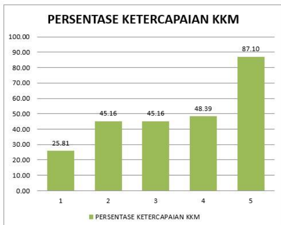
Gambar 9. Grafik Persentase Ketercapaian KKM