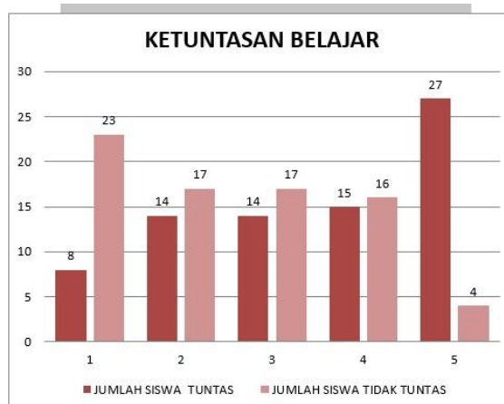
Gambar 8. Grafik Ketuntasan Belajar