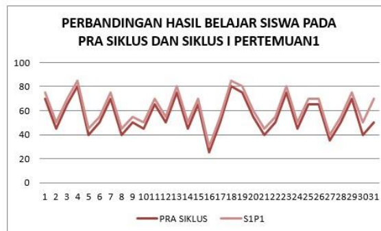
Gambar 2. Grafik Perbandingan Hasil Belajar Siswa Pada Pra Siklus Dan Siklus I Pertemuan 1

Berdasarkan hasil data, pada proses pembelajaran pada Siklus I Pertemuan 1 ini, memperlihatkan bahwa proses pembelajaran Bahasa Indonesia materi Teks Eksposisi memperlihatkan bahwa tingkat hasil belajar Bahasa Indonesia materi Teks Eksposisi siswa secara klasikal masih di bawah standar, yaitu nilai rata-rata kelas 61,29 dengan 14 siswa tuntas atau 45,16% dari 31 siswa masih jauh dari nilai KKM \geq 70 yang diharapkan, maka untuk itu perlu dilakukan perbaikan kembali Siklus I pertemuan 2.