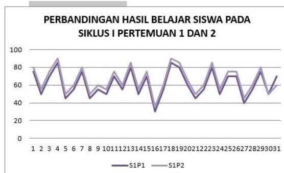
Gambar 3. Grafik Perbandingan Hasil Belajar Siswa Pada Siklus I Pertemuan 1 dan 2

Berdasarkan hasil data, pada proses pembelajaran pada Siklus I Pertemuan 2 ini, memperlihatkan bahwa proses pembelajaran Bahasa Indonesia materi Teks Eksposisi memperlihatkan bahwa tingkat hasil belajar Bahasa Indonesia materi Teks Eksposisi siswa secara klasikal masih di bawah standar, yaitu nilai rata-rata kelas 65,65 dengan 14 siswa tuntas atau 45,16% dari 31 siswa masih jauh dari nilai KKM \geq 70 yang diharapkan, maka untuk itu perlu dilakukan kembali Siklus II Pertemuan 1.