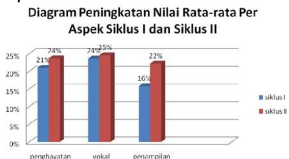
Diagram 6 Peningkatan Nilai Rata-rata Per Aspek Siklus I dan Siklus II

Berdasarkan deskripsi pembahasan data tes keterampilan membaca puisi siswa kelas X di atas, dapat disimpulkan bahwa model yang digunakan oleh peneliti dapat meningkatkan keterampilan membaca puisi siswa kelas VII.I SMP Negeri 1 Tambun Utara.