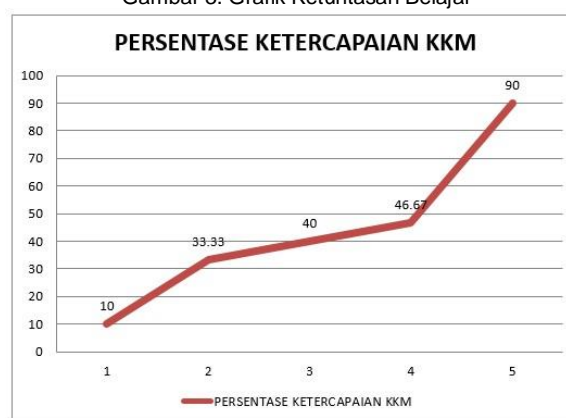
Gambar . Grafik Persentase Ketercapaian KKM