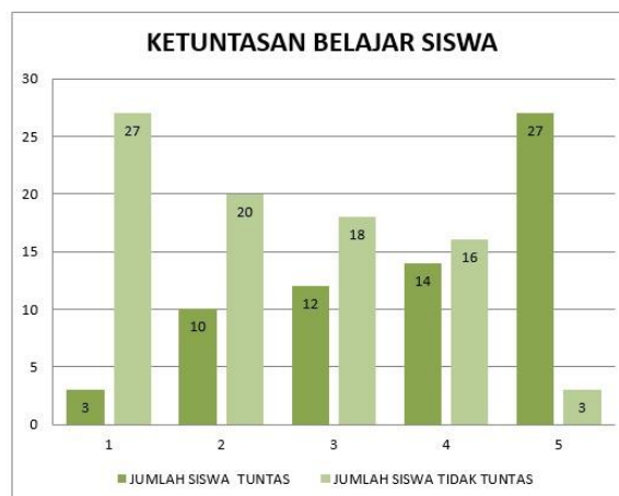
Gambar 3. Grafik Ketuntasan Belajar

Berikut adalah data-data yang disajikan dalam bentuk grafik peningkatan ketuntasan belajar siswa, grafik ketercapaian ketuntasan belajar siswa dan persentase ketercapaian KKM.