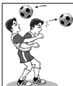
Gambar 3. Menyundul bola

Menyundul bola pada hakikatnya adalah memainkan bola dengan menggunakan kepala. Tujuannya untuk mengumpan, mencetak gol, dan mematahkan serangan lawan/membuang bola.