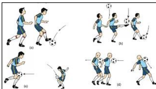
Gambar 1. Menghentikan bola dengan bermacam cara