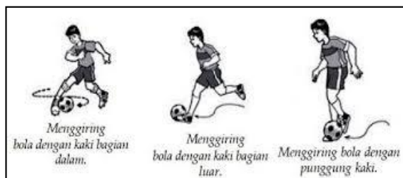
Gambar 2. Menggiring bola dengan bermacam cara

Menggiring bola adalah menendang bola terputus-putus atau pelan-pelan, bagian kaki yang dipergunakan dalam menggiring bola, yaitu kaki bagian dalam, kaki bagian luar, dan punggung kaki.