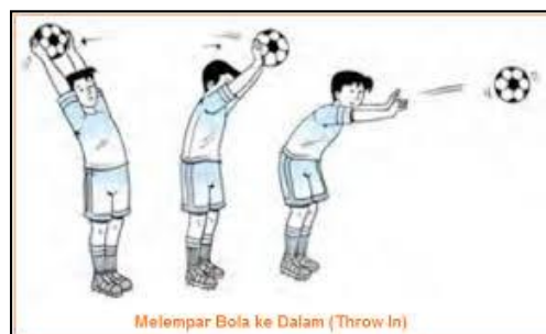
Gambar 4. Lemparan ke dalam ( Throw – in )

Lemparan ke dalam merupakan satu-satunya teknik dalam permainan sepak bola yang dimainkan dengan lengan dari luar lapangan permainan. Dapat dilakukan dengan atau tanpa awalan, baik dengan posisi kaki sejajar maupun salah satu kaki ke depan.